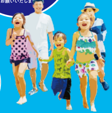
※イラストは「スライダーパーク」内のイメージです。 実際とは異なります。