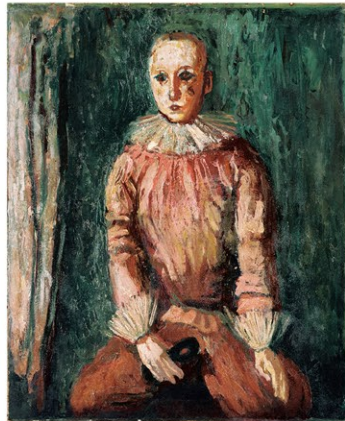
三岸好太郎《少年道化》1929年、東京国立近代美術館蔵