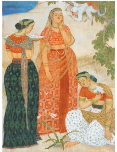
小杉放菴《羅摩物語》1928年、東京国立近代美術館蔵