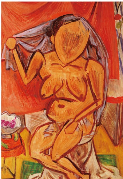
萬鐵五郎《羅布かつく人》1925年、岩手県立美術館蔵