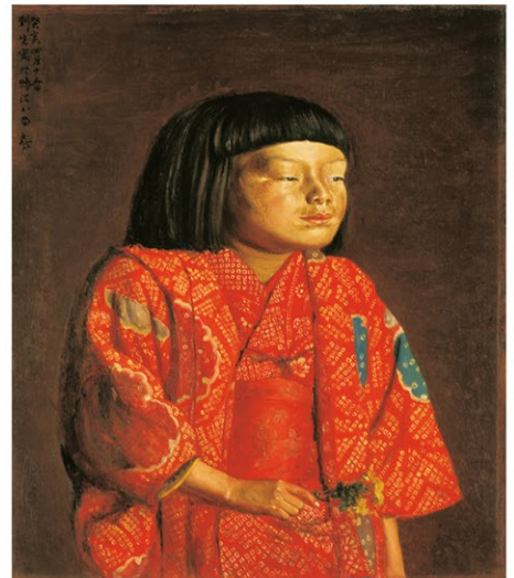
岸田劉生《童女図(麗子立像)》1923年、神奈川県立近代美術館蔵

◎交通案内:【電車】名鉄本線「知立駅」もしくはJR「刈谷駅」乗換、名鉄三河線「碧南駅」下車、南西方向へ徒歩6分/【車】知多半島道路・阿久比ICから車で約20分(衣浦大橋を渡って右折) ※駐車台数に限りがありますので、公共交通機関をご利用ください。