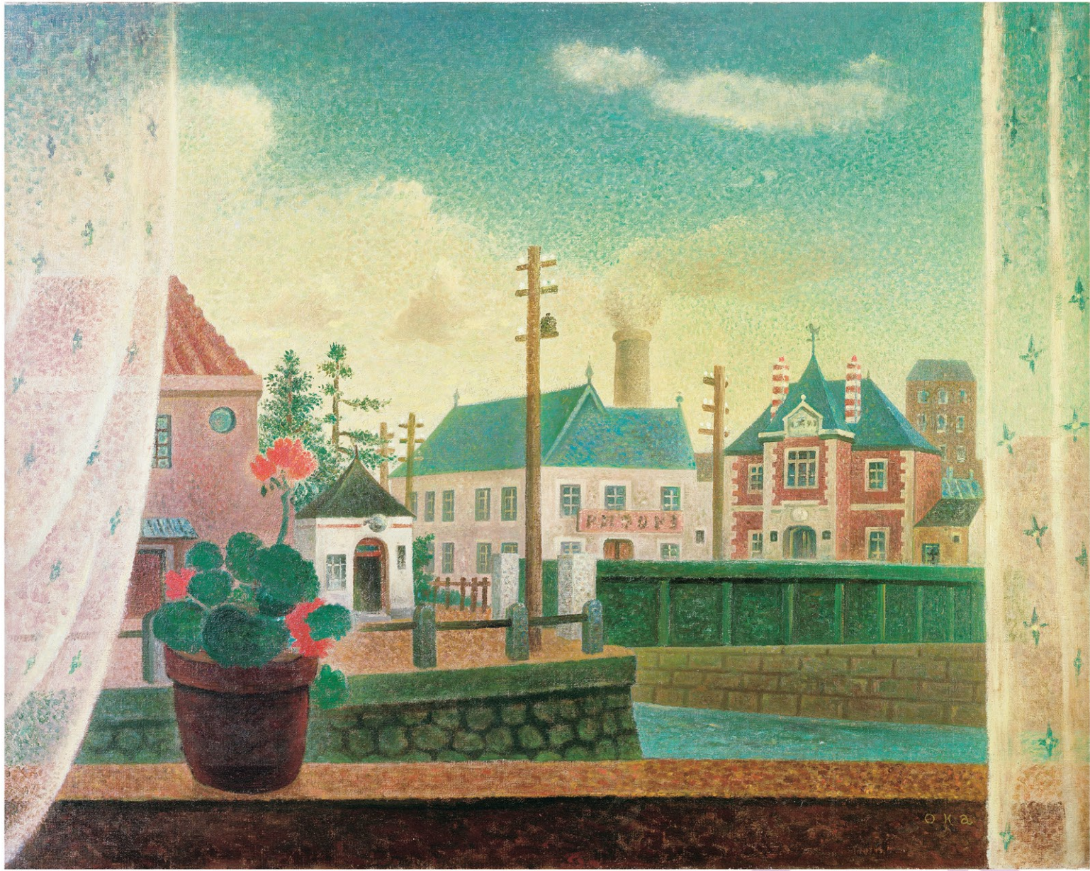
岡鹿之助《窓》1949年、愛知県美術館蔵