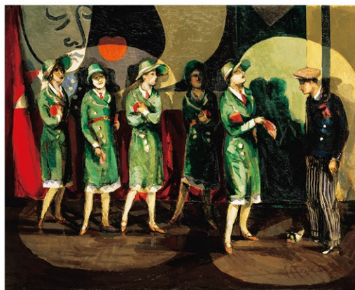
木村荘八《私のラバさん》1934年、愛知県美術館蔵