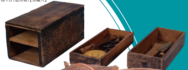
削り台(道具箱)【筌職人】

本展覧会では大工や鍛冶屋、桶屋など人々の暮らしの身近にいた職人から、安城の地場産業であるそうめんや花火の職人まで、さまざまな職人の仕事と道具を紹介します。