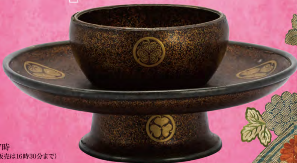
[刈谷市指定]伝通院調度品のうち天目台(楞嚴寺蔵)

前期: 10.14(土) ~ 11.5(日) 後期: 11.7(火) ~ 11.26(日) 「一部展示替」