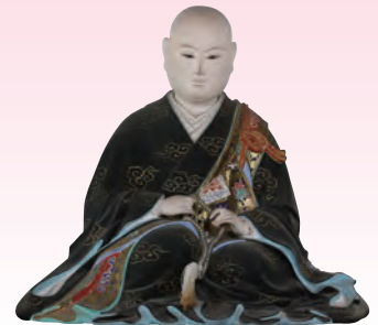
清浄院座像(熊本・法宣寺蔵)