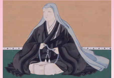
芳春院妙西尼像(部分)(専福寺蔵・岡崎美術博物館寄託)