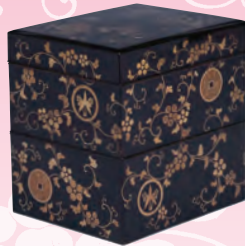
[阿久比町指定] 重箱(洞雲院蔵)