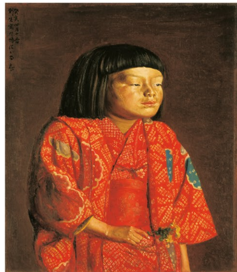
岸田劉生《童女図(獅子立像)》1923年、神奈川県立近代美術館蔵

◎交通案内:【電車】名鉄本線「知立駅」もしくはJR「刈谷駅」乗換、名鉄三河線「碧南駅」下車、南西方向へ徒歩6分/【車】知多半島道路・阿久比ICから車で約20分(衣浦大橋を渡って右折) ※駐車台数に限りがありますので、公共交通機関をご利用ください