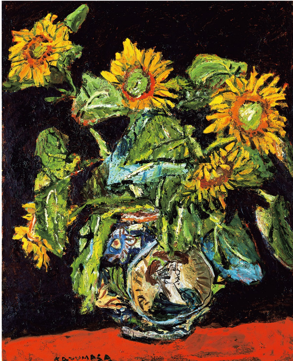
中川一政《向日葵》1982年、真鶴町立中川一政美術館蔵