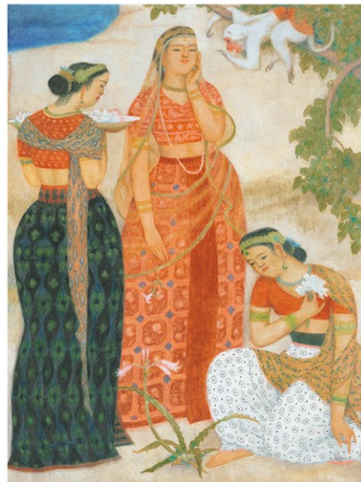
小杉放菴《羅摩物語》1928年、東京国立近代美術館蔵