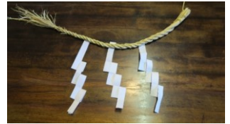
講師：わら細工 島、都築

日時：令和4年12月10日(土) 10:00～12:00 参加費：1,200円 定員：12名 内容：自分だけのしめ縄を作り、新年を迎えましょう。 募集開始日：10月19日(水)